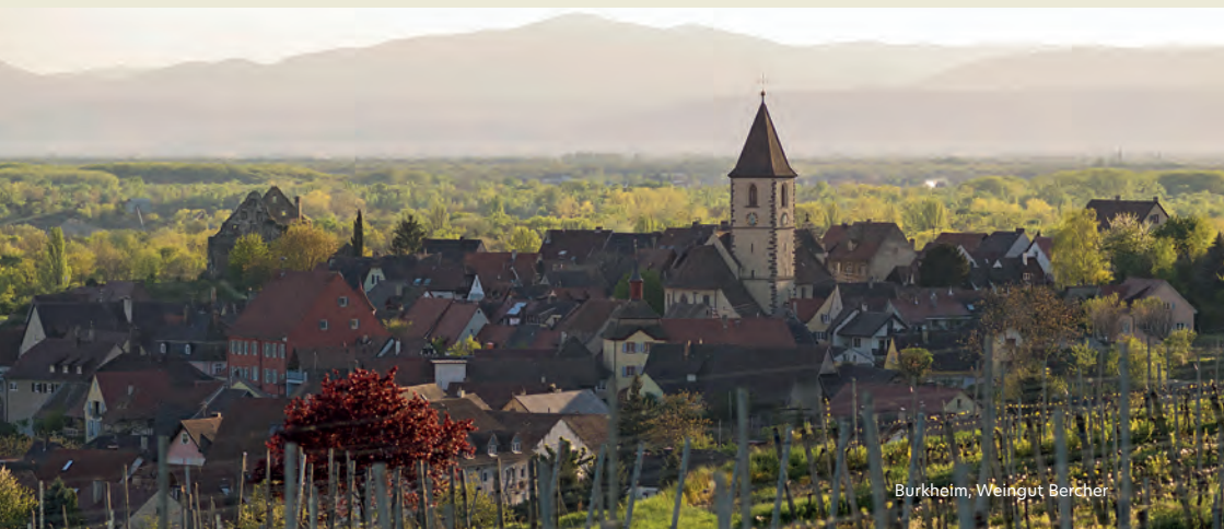
Burkheim, Weingut Bercher

Die Familie Bercher führt das Weingut in Burkheim bereits in zehnter Generation. Die charakteristischen Vulkanböden am Kaiserstuhl prägen die Stilistik der Weine, die im Keller mit viel Geduld und Feingefühl vinifiziert werden. Das Ziel ist klar: elegante Weine mit feiner Struktur und nachhaltiger Länge, die durch Raffinesse statt Kraft überzeugen.