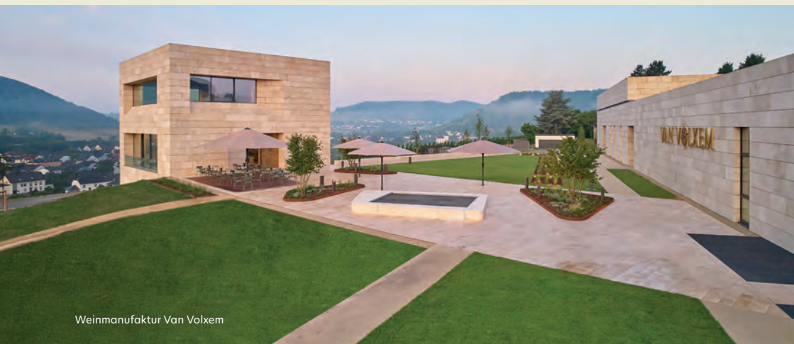
Weinmanufaktur Van Volxem