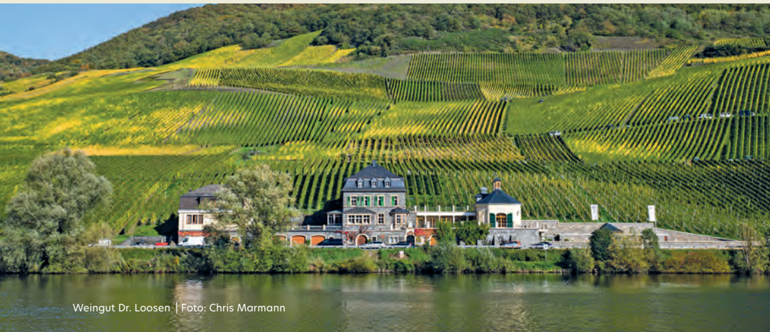
Weingut Dr. Loosen