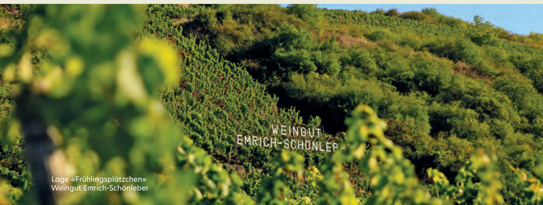
Lage «Frühlingsplätzchen» Weingut Emrich-Schönleber

Mit voller Hingabe bewirtschaftet die Familie Schönleber in Monzingen seit Jahrzehnten rund 20 Hektar – davon 75% in den steilen Spitzenlagen «Frühlingsplätzchen» und «Halenberg» – und kultiviert diese mit Handarbeit und Leidenschaft. Die Böden bestehen hauptsächlich aus rotem und blauem Schiefer sowie Quarzit, was den Rieslingen aromatische Finesse, würzig-mineralische Tiefe und präzisen Charakter schenkt – echte Terroir-Weine mit Ausdruckskraft und Authentizität.